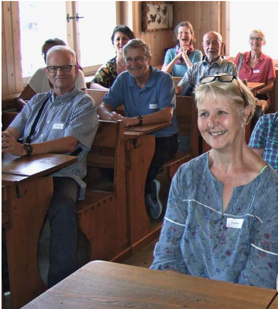
Sur les bancs de l'école.

ANNIVERSAIRE >>> Plus de 80 personnes, dont 30 étaient là pour la première fois, se sont retrouvées le 18 juin sous un soleil radieux, à l'occasion de la 10 e fête des retraité-e-s de Nest pour un rendez-vous gastronomique à Waldegg.